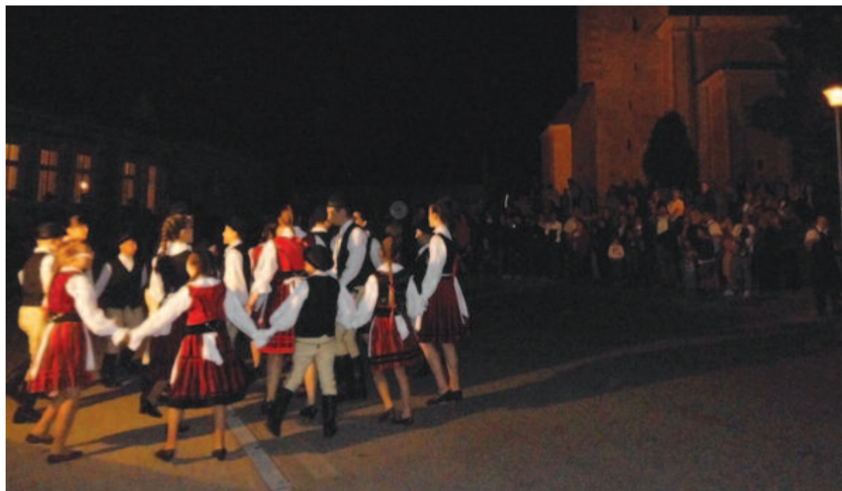
Táncosok az éjszakában Alfaluban