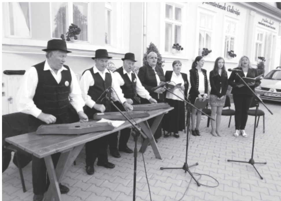
A gyergyóalfalvai citerazenekar és dalosai

Isten áldása legyen az emléken, Isten áldása legyen a kedves szülőfalun! (Böloni Domokos)