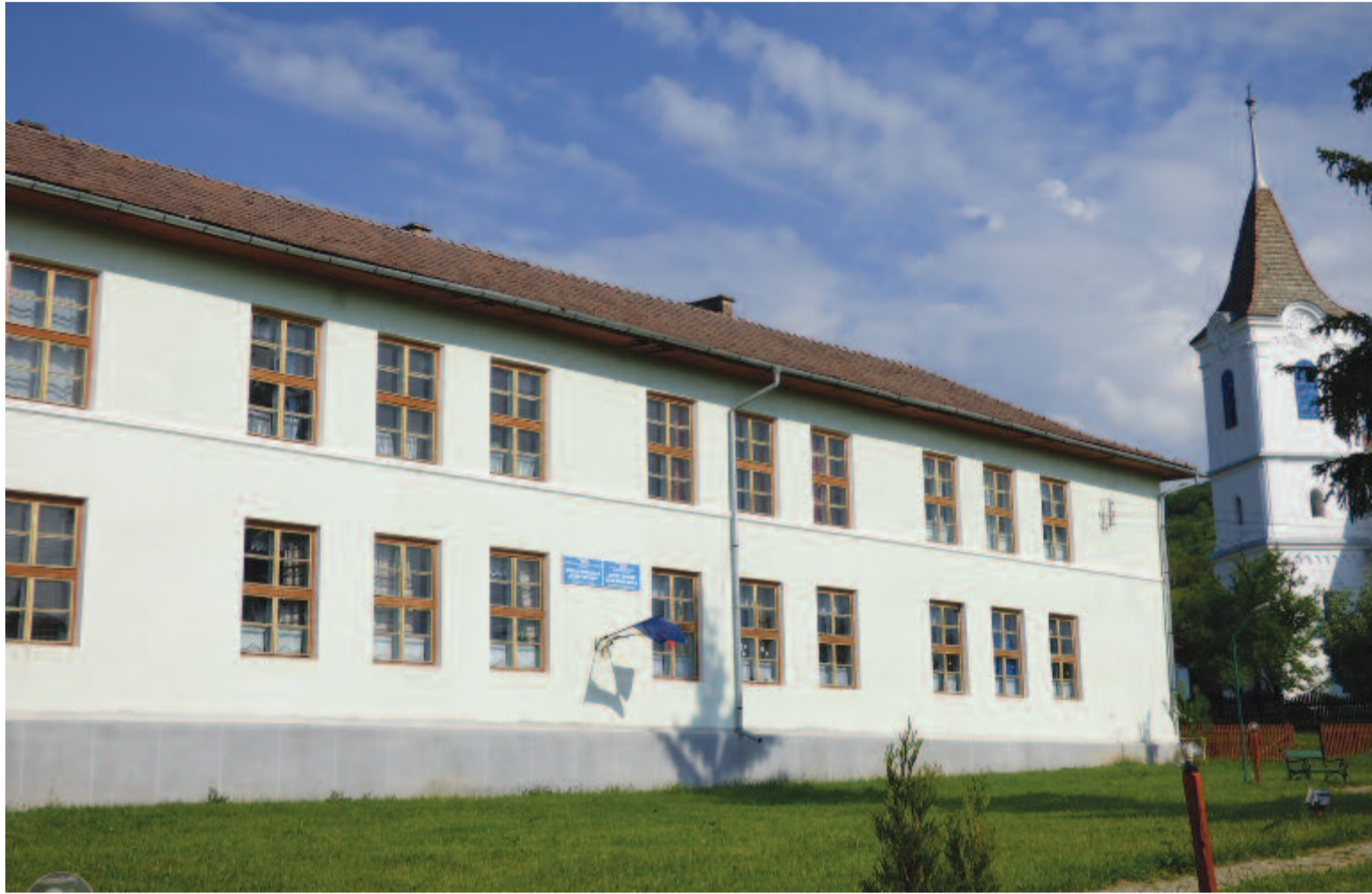
Szentistvánon az iskola tetőzete van a legnagyobb veszélyben